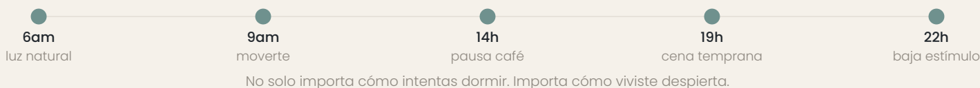
FIG. 03 · EL SUEÑO EMPIEZA EN LA MAÑANA

A veces por estrés. A veces por horarios caóticos. A veces por pantallas, luz artificial, cafeína o cenas tardías. Y muchas veces por vivir demasiado en alerta.